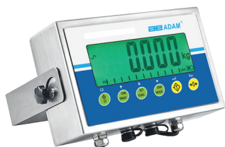
Indicador AE 403