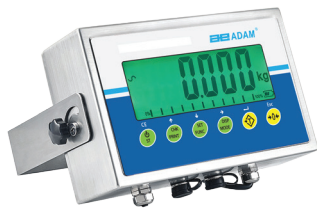
Indicateur AE 403